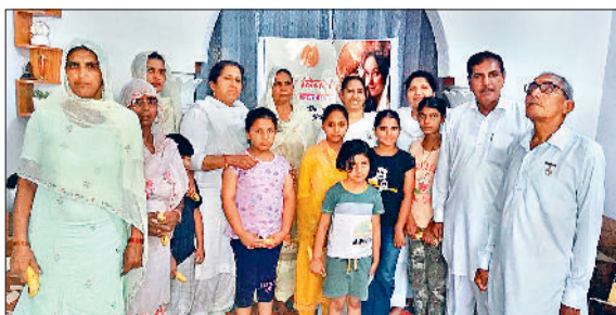
नारायणगढ़। मातृदिवस के उपलक्ष्य में उपस्थित बिके बहन व अन्य।

संस्कृति में कहा गया है कि मातृदेवो भव, अर्थात् माँ की तुलना व उपमा भगवान से की गई है। क्योंकि एक मां का बच्चे के जीवन में जो महत्व