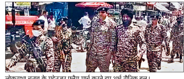
लोकसभा चुनाव के मद्देनजर फ्लैग मार्च करते हुए अर्ध सैनिक बल।