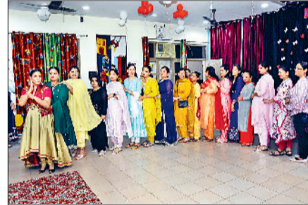
अंबाला। मदर्स डे पर कार्यक्रम में हिस्सा लेती शिक्षिकाएं व रंगारंग कार्यक्रम प्रस्तुत करते छात्र।

मातृ दिवस मुरलीधर डीएवी पब्लिक स्कूल सीनियर व जूनियर विंग में बड़े जोश और उत्साह के साथ मनाया गया। पहले मातृ दिवस के उपलक्ष्य में छात्रों द्वारा विभिन्न गतिविधियां प्रस्तुत की गईं। इसके माध्यम से उन्होंने अपनी मां के प्रति प्रेम प्रदर्शित किया। कक्षा तीसरी व चौथी के छात्रों ने ज्वेलरी बॉक्स बनाया। कक्षा पांचवी से आठवी के छात्रों ने फोटो प्रेम प्रतियोगिता में भाग लिया और मां की फोटो लगाई। कक्षा नौवी से बारहवी के छात्रों ने अपनी माता के लिए ज्वेलरी बनाई।