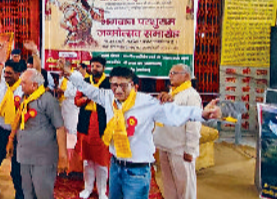
कुरुक्षेत्र। परशुराम जन्मोत्सव के अवसर पर भजनों पर झूमते गणमान्य।