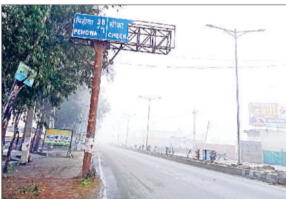
गुहला चीका। कैथल से चीका मार्ग पर टूटा हुआ सांकेतिक बोर्ड।

चीका शहर में मुख्य सड़कों पर जगह जगह लगे सांकेतिक बोर्ड वर्तमान में शहर की खूबसूरती को बर्तमान बना रहे हैं। जानकारी के अनुसार कुछ समय पहले यहां सांकेतिक बोर्ड लगाए गए थे परन्तु प्रशासन को लापरवाही के चलते वे रखरखाव के अभाव में उक्त बोर्ड पूरी तरह से टूट चुके हैं और उनके फ्लैक्स उखड़ गए हैं। परन्तु प्रशासन द्वारा इस तरह ध्यान न देना यह दर्शाता है कि अधिकारी अपने काम के प्रति कितने सजग हैं नतीजतन ना तो सम्बन्धित विभाग और न ती उच्च प्रशासकीय अधिकारी टूटे हुए सांकेतिक बोर्डों को ठीक करवाने के उपायों को लेकर अधिकारियों की लापरवाही का आलम यह है कि