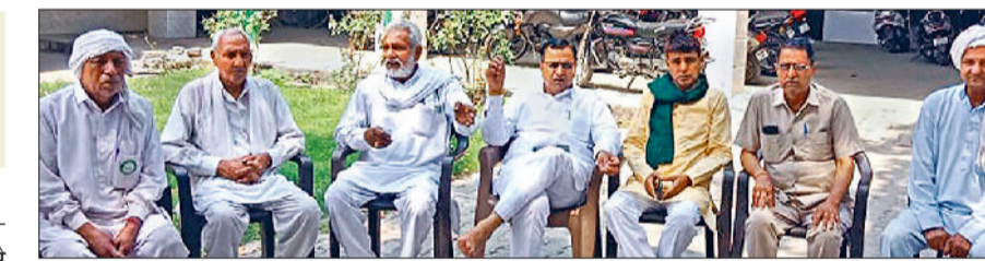
पानीपत। पानीपत के किसान भवन में प्रेस वार्ता करते हुए भाकियू नेतागण।