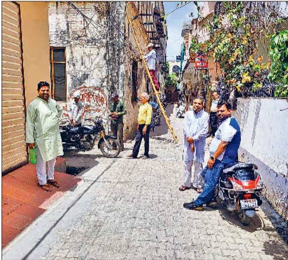
अंबाला। वार्ड नंबर 9 में स्ट्रीट लगाने का दृश्य।

लाइट्स लगाने का वर्कऑर्डर आचार संहिता से 2 दिन पूर्व दिया गया था। एजेंसी ने इस पर काम आचार संहिता के दौरान शुरू कर दिया था। निगम ने स्मार्ट स्ट्रीट लाइट्स के लिए 13.68 करोड़ रुपए का टेंडर लगाया था। यह आचार संहिता लगने से एक दिन पूर्व लगाया गया था। इसकी अंतिम तारीख 15 अप्रैल थी। आचार संहिता के बीच कोई भी नया काम शुरू नहीं किया जा सकता। फिर भी निगम की ओर से इसका वर्कऑर्डर जारी कर दिया गया। 2 एजेंसियों को अलग-अलग वर्कऑर्डर जारी